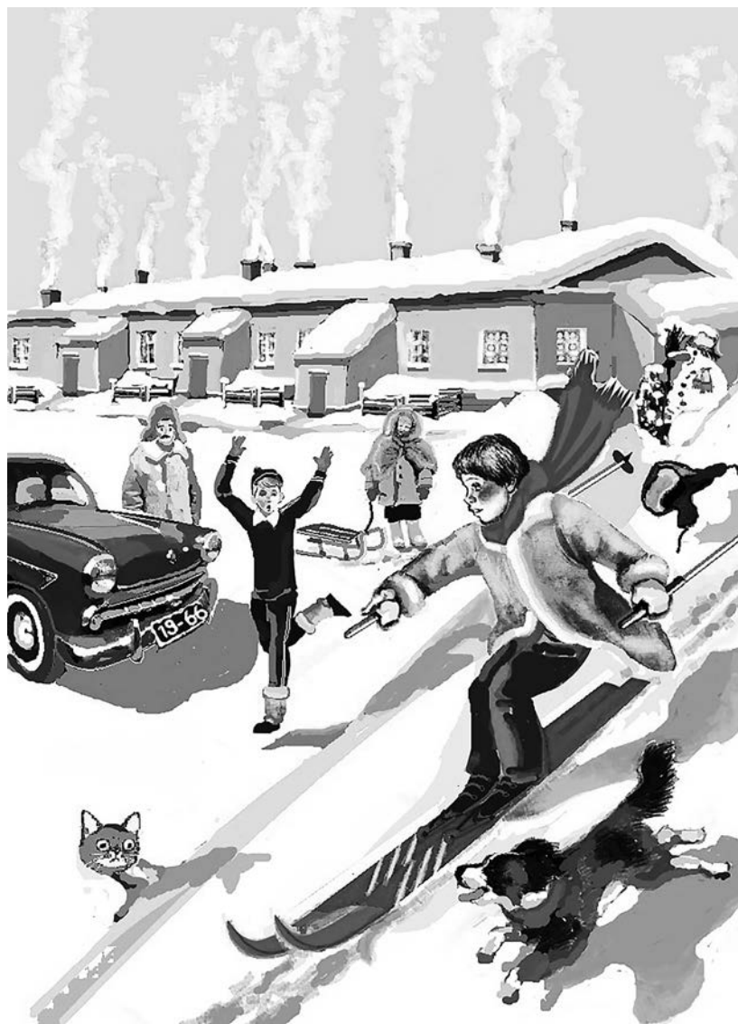
Рисунок Анатолия Грешилова