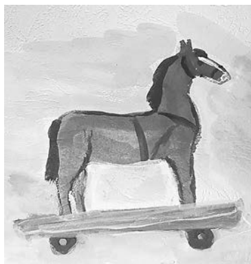
Рисунок Марии Снегирёвой

Здесь каждый дом найдём, Хоть глаза завяжи. Где-то за тем углом Детство вдаль бежит.