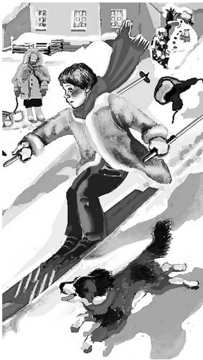
Рисунок Анатолия Грешилова