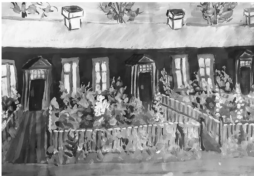
Рисунок Марии Снегирёвой

Последующие несколько дней мы, едва проснувшись, бежали к скворечникам в надежде увидеть поселившихся там скворцов, но они почему-то облетали стороной построенные для них домики. Примерно через неделю скворечник, закреплённый под крышей дома, облюбовали воробьи. Иван поначалу отгонял их камнями, но юркие птички упорно возвращались. Наконец он смирился, сказав нам: