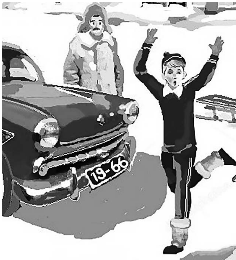
Рисунок Анатолия Грешилова

в 1993-м, в конце августа, я, оказавшись в родном городе, проходил по улице Тараса Шевченко и возле железнодорожной поликлиники увидел припаркованный к тротуару знакомый мне «Москвич». Не удержавшись, я подошёл и заглянул в салон. Прошло