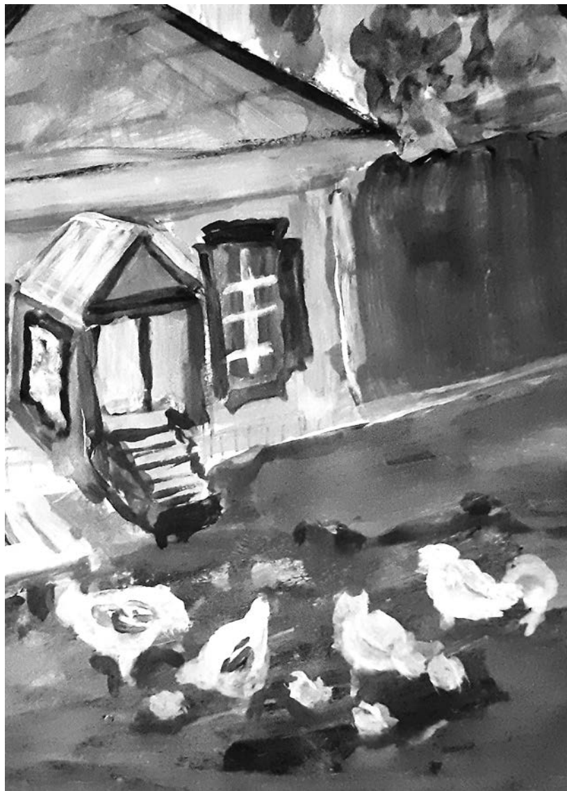
Рисунок Марии Снегирёвой