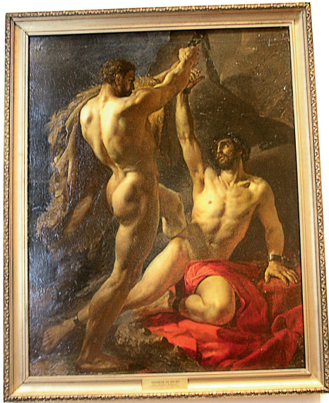
Н. Тихобразов. «Геркулес освобождает Прометея», 1843 г.

Не Геркулес я, жаль, но что поделаешь?! Пишу и посвящаю Прометею – смелому... Бесстрашие коснулось клавиш позвонков... Мечте служенье – всех сильней оков. И здесь бессилен даже гнев Богов!..